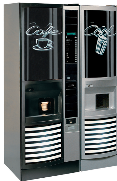
LUCE Speed-Mix mit Post-Mix Modul.

Getränkeausgabe nach Wunsch in Tassen, Bechern, Caffépöten